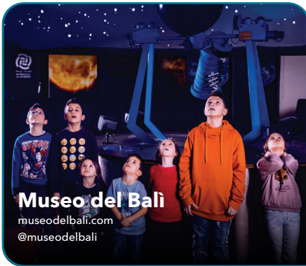
Museo del Bali museodelbali.com @museodelbali