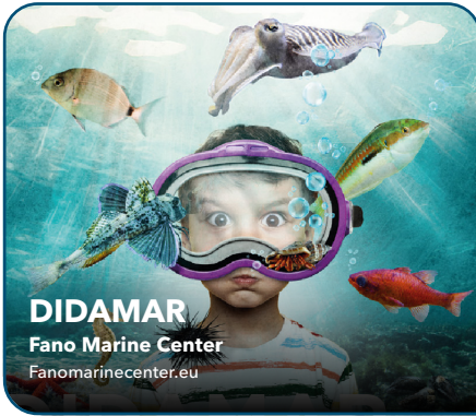
DIDAMAR Fano Marine Center Fanomarinecenter.eu