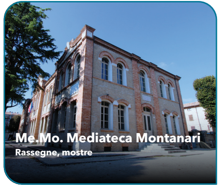
Me.Mo. Mediateca Montanari Rassegne, mostre