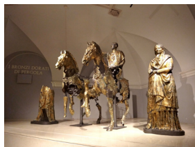
BRONZI DORATI DI PERGOLA