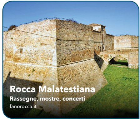
Rocca Malatestiana Rassegne, mostre, concerti fanorrocca.it