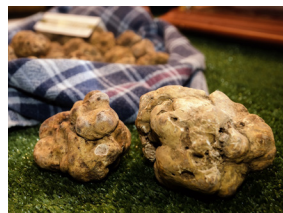
TARTUFO DI ACQUALAGNA

Le Valli del Metauro e del Cesano dialogano con la città di Fano come un'unica destinazione, viva e plurale, entro cui si instaura la capacità di generare esperienze uniche per gli ospiti.