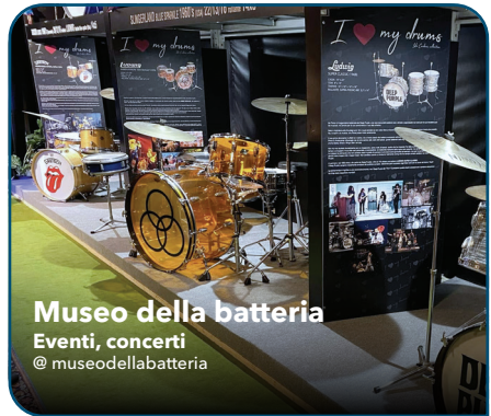
Museo della batteria Eventi, concerti @museodellabatteria