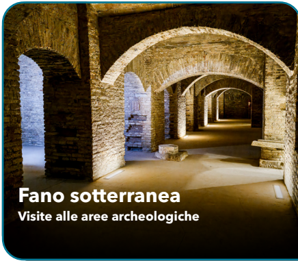
Fano sotterranea Visite alle aree archeologiche